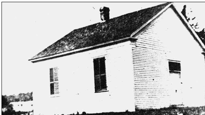
Capel Wesla Ninety-Six

Y mae dyfod o hyd i hanes Capel Wesla Ninety-Six fel chwilio am aur. Hyd y gwn i nid oes neb wedi cofnodi stori'r achos yno yn llawn. Byddai'n rhaid croesi'r lwerydd i'r archifdai yng ngogledd Talaith Efrog Newydd i wneud cyfiawnder â'r hen gapel hwnnw.