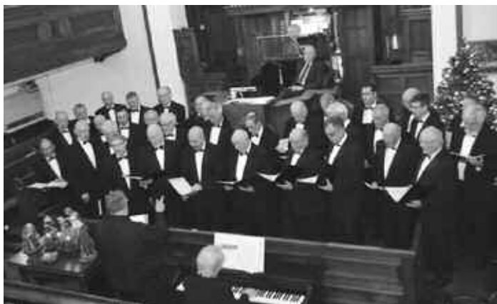
Côr Meibion Colwyn