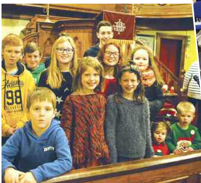
Gwasanaeth Nadolig yn Shiloh, Tregarth