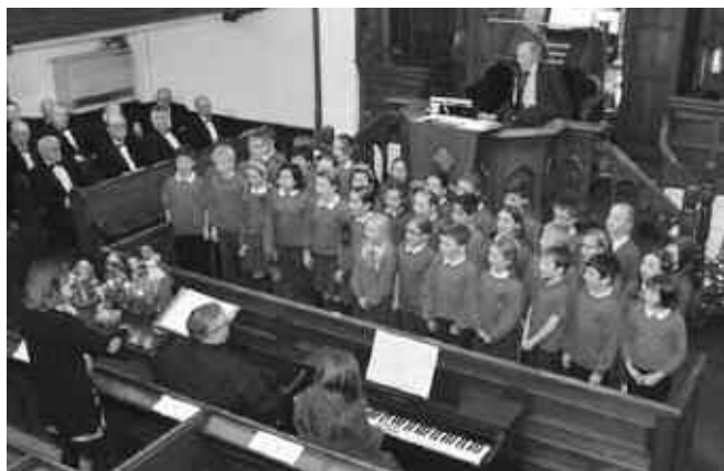
Plant Ysgol Bod Alaw