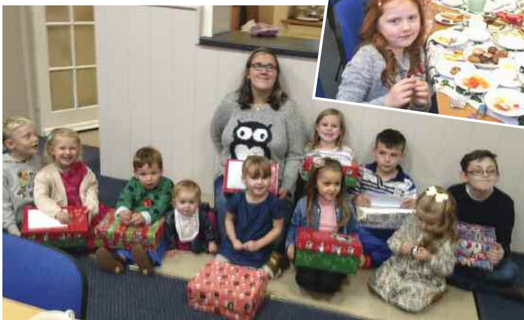
Bu plant Ysgol Sul Bethel Prestatyn yn brysur yn helpu i baratoi bocsys 'Plentyn y Nadolig' i'w hanfon at blant anghenus na fuasai fel arall yn cael anrheg