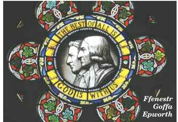
Ffenestr Goffa Epworth

Pan ostyngwyd ei gorff i'r ddaear gyda'r geiriau, "Gan gymaint y