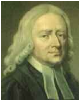
John Wesley, 17 Mehefin, 1703 – 2 Mawrth, 1791

Dyna sut mae marw'n dda. Mi gymerais angladd gŵr ifanc yn ddiweddar oedd wedi dioddef yn hir o afiechyd terfynol. Gwnaethpwyd popeth yn yr ysbyty i geisio achub ei fywyd. Roedd dyfodol disglair o'i flaen. Ond methwyd â'i arbed, er tristwch mawr i'w deulu a'i ffrindiau. Yn ystod y misoedd hir yn yr ysbyty arferai eistedd yn ddistaw yng nghapel yr ysbyty yn myfyrio. A phan ddaeth y diwedd diolchodd yn arbennig i'r nyrsys a'r meddygon oedd wedi ei ymgeleddu mor hir ac mor dda. Aeth yn ufudd ac yn dawel i'w gartref nefol er mawr gysur i'w deulu. Dyna beth yw marw'n dda.