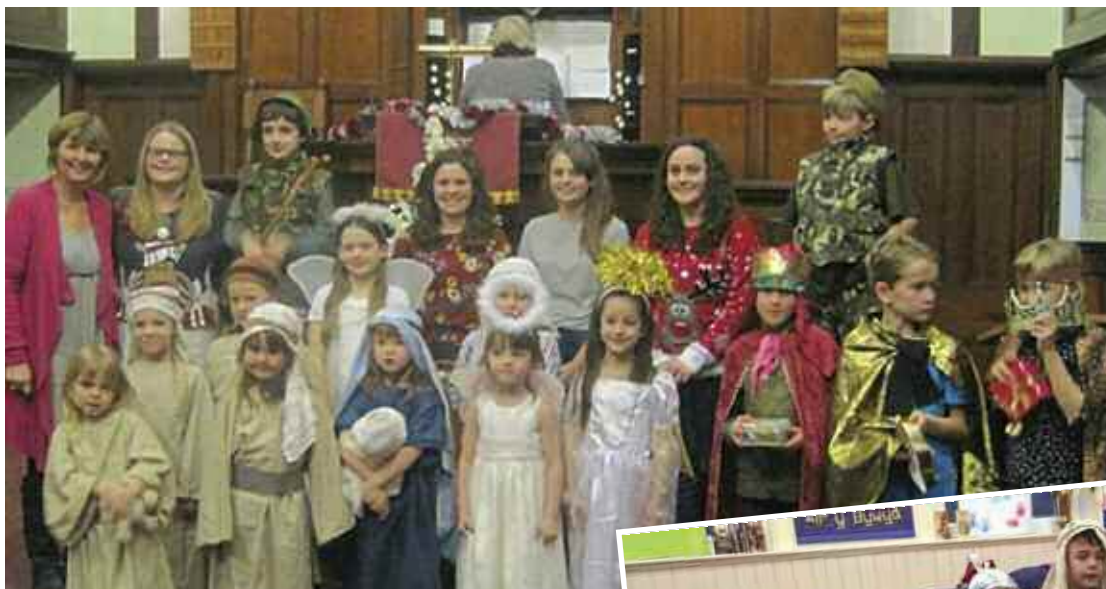
Drama'r Geni, Ysgol Sul Undebol Llanfyllin