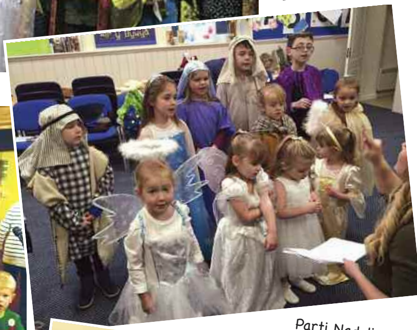
Parti Nadolig yn Ebeneser, Eglwysbach