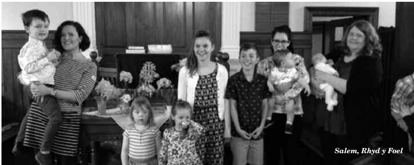
Salem, Rhyd y Foel