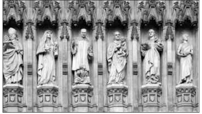
Merthyron yr 20fed ganrif, Abaty Westminster

Cawsom ein hannog ganddo i edrych y tu hwnt i orwelion ein bro a’n gwlad, i estyn llaw i gyfarch a chefnogi eraill o draddodiadau gwahanol. Rhaid i ni weithio er mwyn dangos bod efengyl Crist yn ffordd amgenach i achub y byd na pharatoi at ryfel.